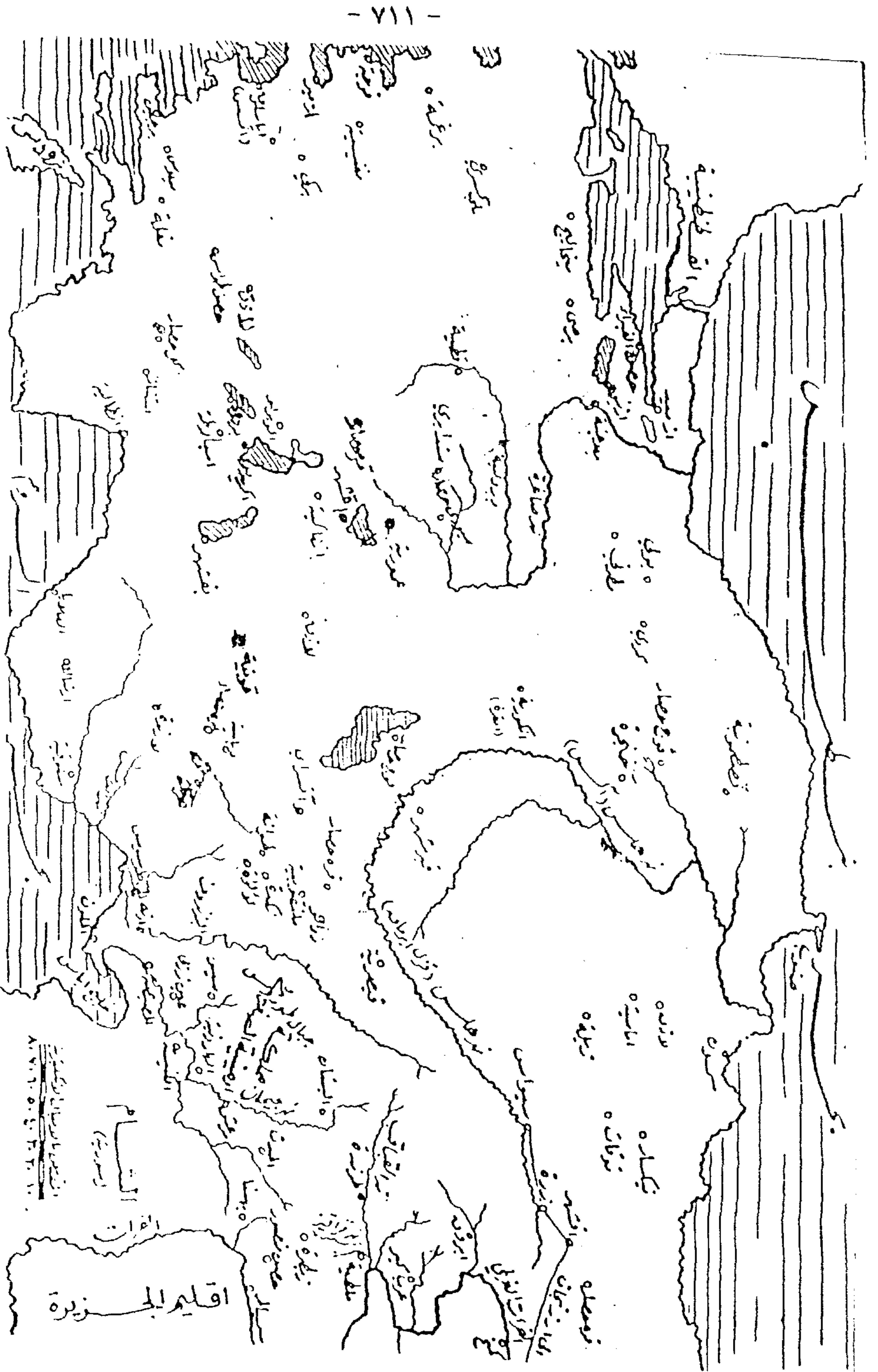
بلاد الروم نقلاً عن كسندر انانج : بلدان الخلافة الشرقية