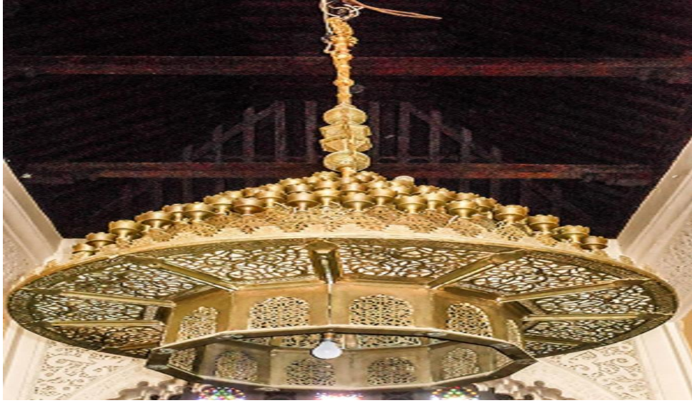
(شكل ٢) ثريا الجامع الكبير بفاس

https://jbhsc.ae/wp-content/uploads/2020/09/magazine-187acf79156119506210381861.jpg