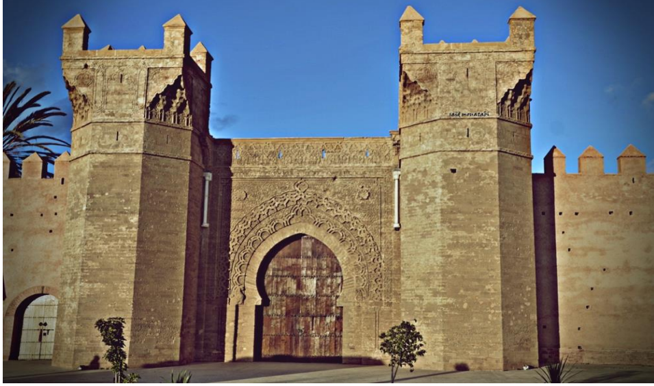
شكل (٤) تحصينات شالة