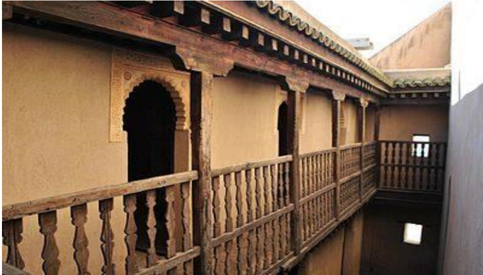
شكل (٣) مارستان سيدي فرج

https://jbhsc.ae/wp-content/uploads/2020/09/magazine-187acf79156119506210381861.jpg