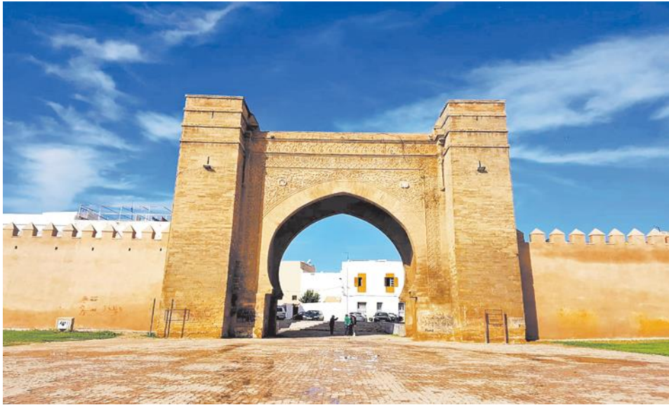
شكل (٥) باب المريسة بسلا